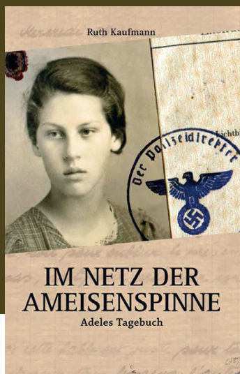
Ruth Kaufmann Im Netz der Ameisenspinne Adeles Tagebuch Roman, 14 x 21,6 cm, 308 Seiten

Adele Kurzweil wurde am 31.01.1925 in Graz geboren. 1938 flüchtete sie mit ihren Eltern vor dem Nazi-Regime nach Paris. Nach dem Einmarsch der Deutschen in Frankreich folgte die Flucht in den unbesetzten Süden.